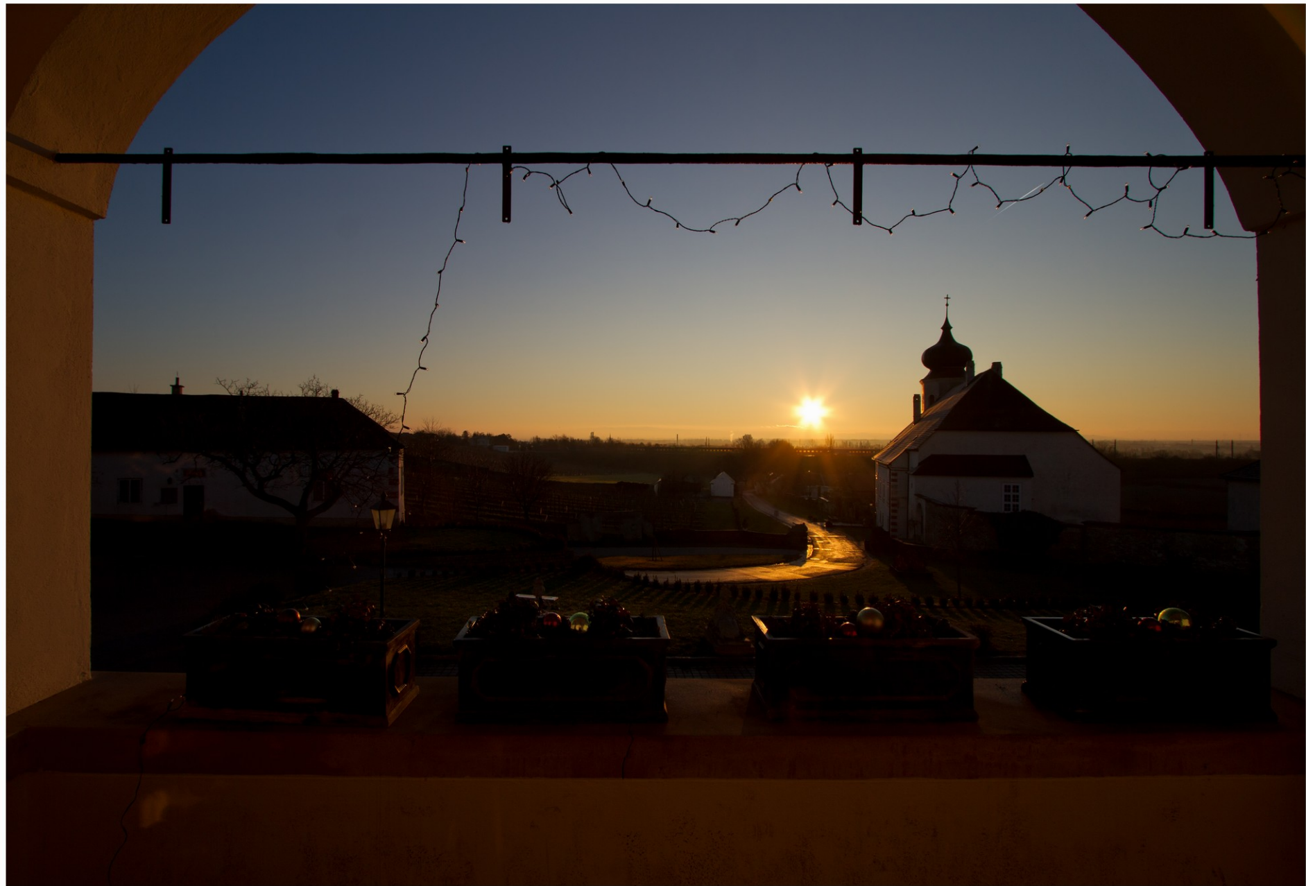
Thallern, 24. 12. 2013