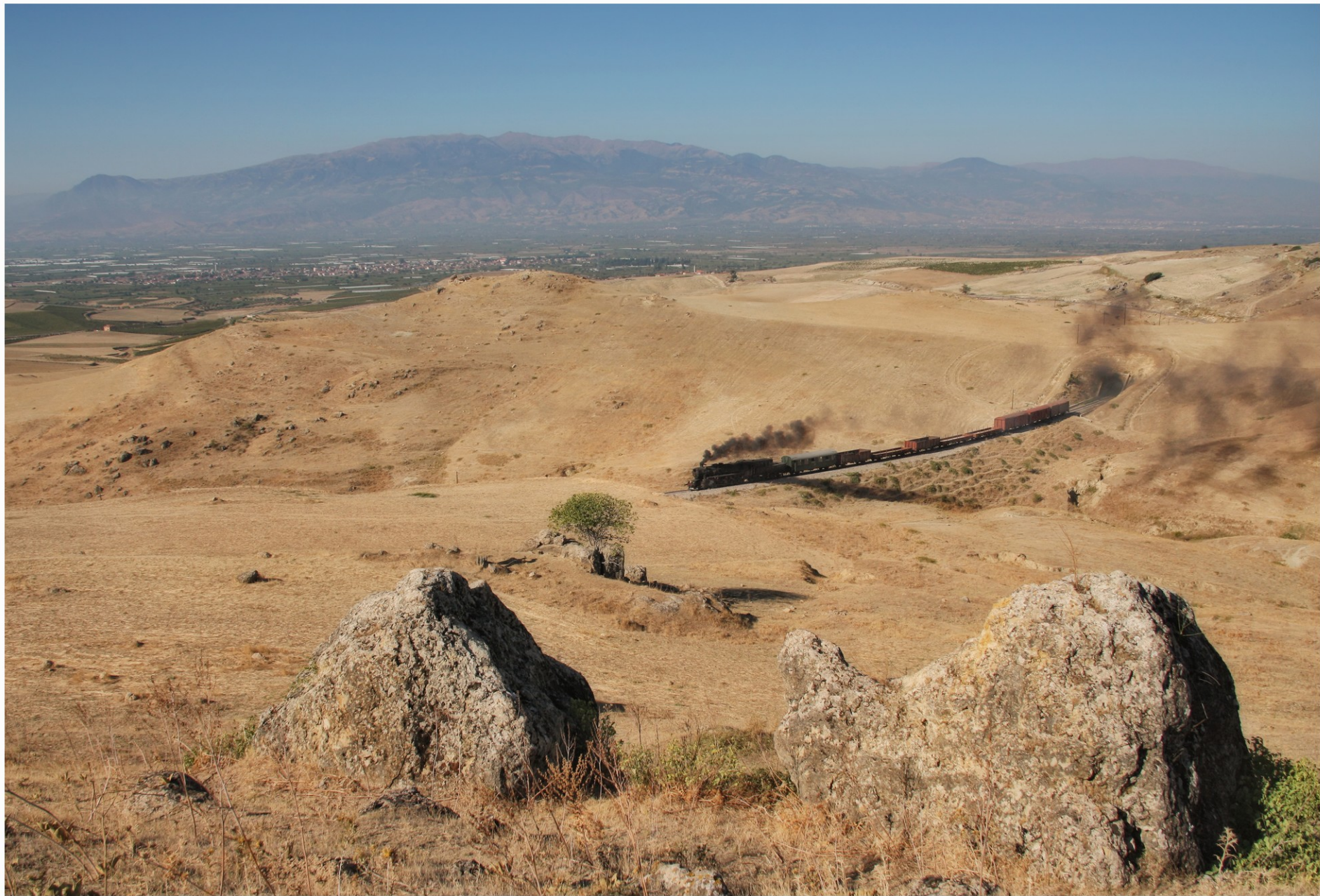
Gümüşçay, 25. 9. 2013