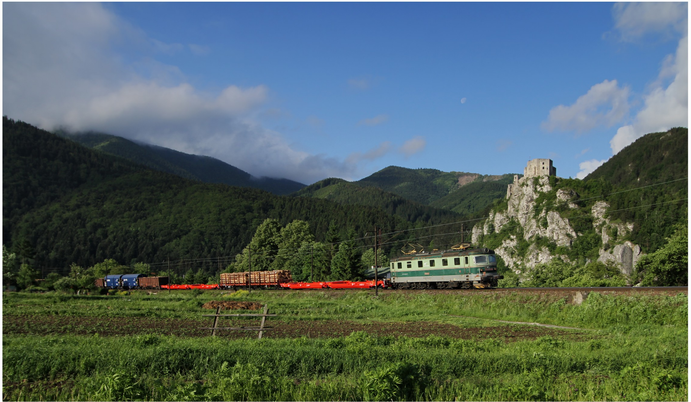
Strecno, 29. 5. 2013