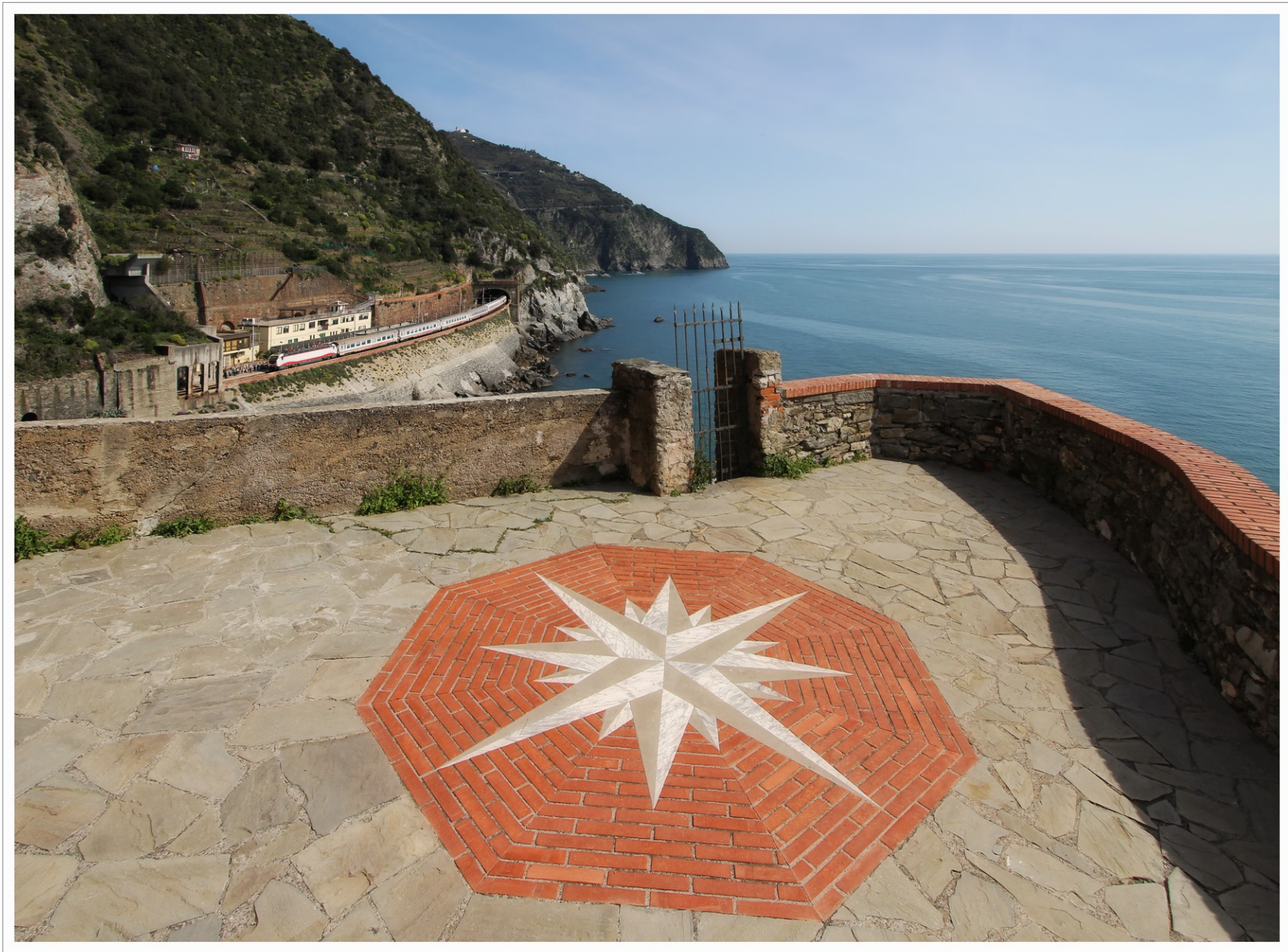
Manarola, 16. 4. 2013