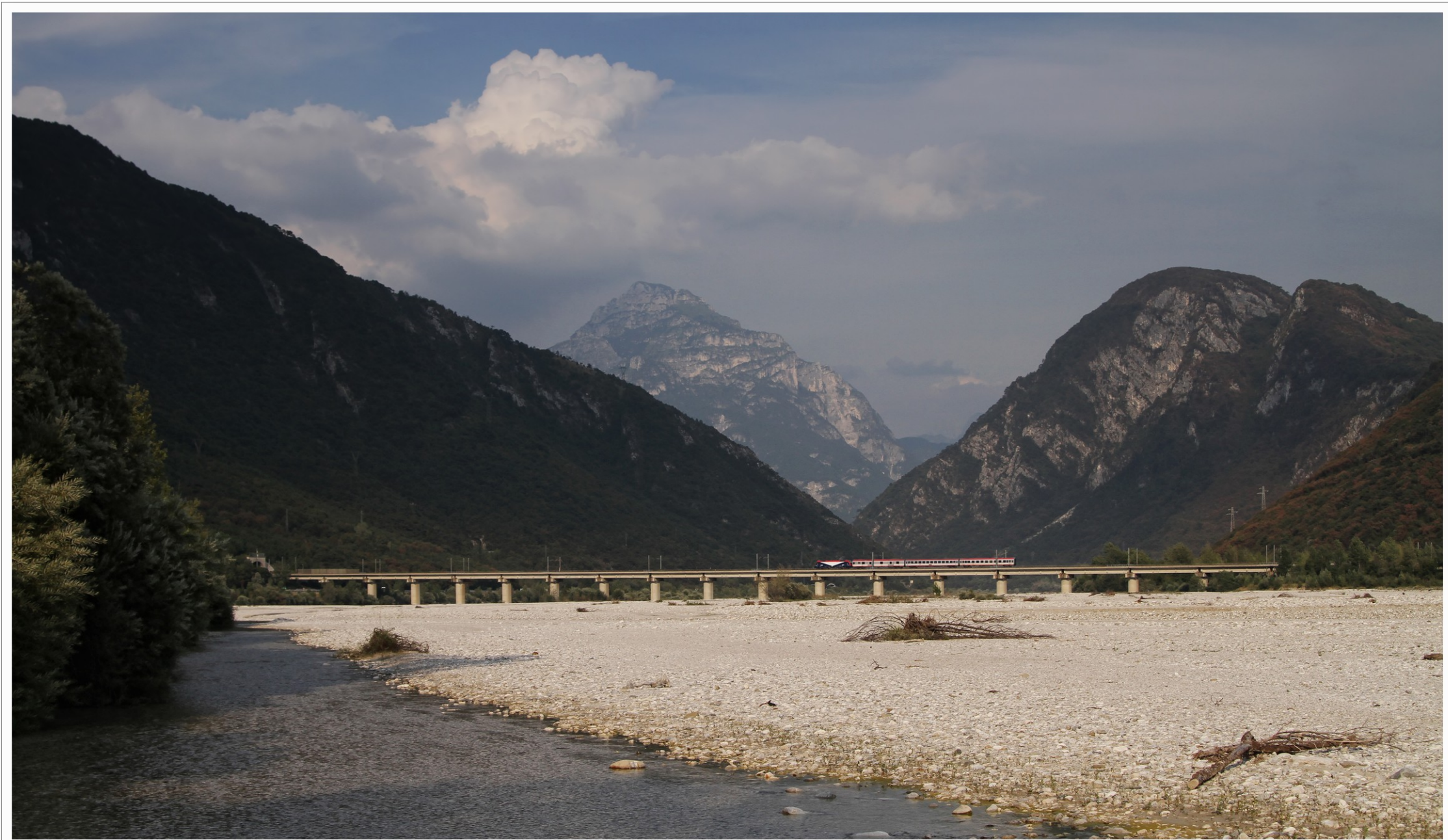
Carnia, 19. 8. 2013