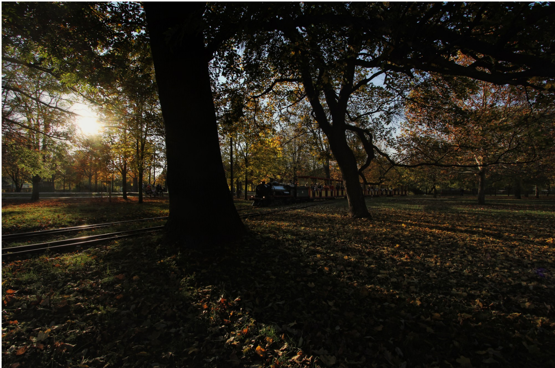
Wien, 26. 10. 2013